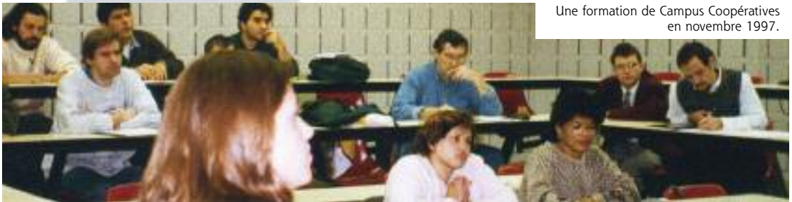
Une formation de Campus Coopératives en novembre 1997.

Un peu avant 1996, le Mouvement coopératif, et le CCQ en particulier, ont commencé à se poser des questions sur le membership de la CDR. C'est dans ces circonstances que j'ai été mandaté par la CDR pour procéder au recrutement de nouveaux membres. Un certain nombre de fédérations, dont Desjardins et la FECHIMM, ont accepté de devenir membres de la CDR. Les règlements de régie interne ont été modifiés. On a commencé à s'orienter vers un membership plus large. »