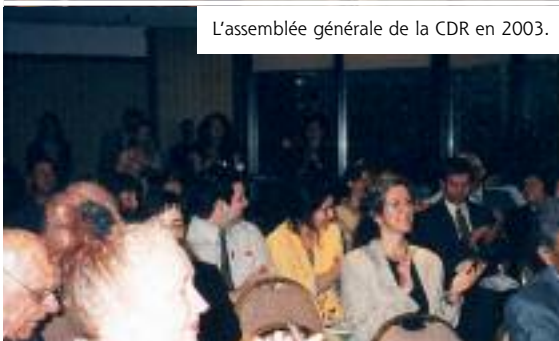
L'assemblée générale de la CDR en 2003.