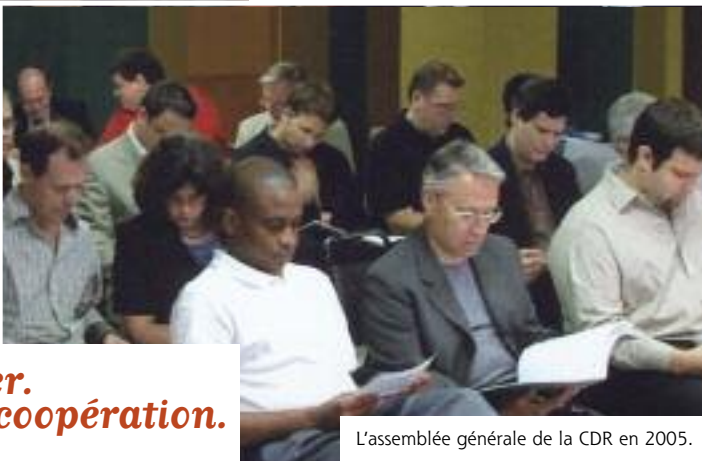
L'assemblée générale de la CDR en 2005.

Créer, innover, développer. L'avenir appartient à la coopération.