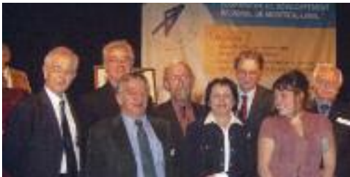
Les lauréats du Prix des coopératives et coopérateurs de l'année des 10 dernières années, Gala des Prix du Mérite 2005.