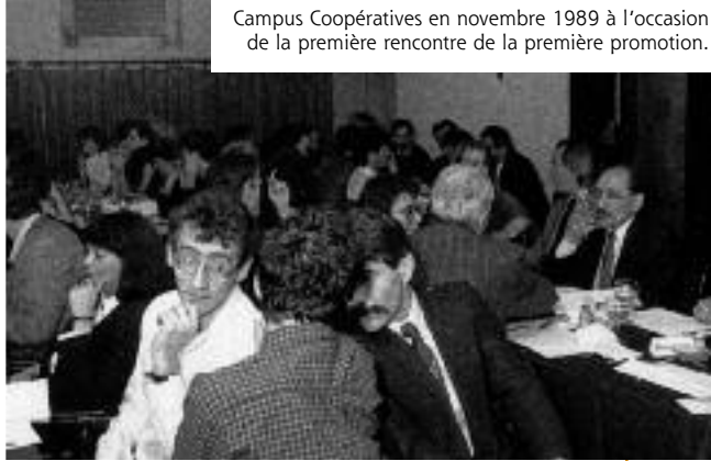
Campus Coopératives en novembre 1989 à l'occasion de la première rencontre de la première promotion.

l'existence même des CDR. Le regroupement a réussi, par une action politique concertée, à sauver quatre CDR. »