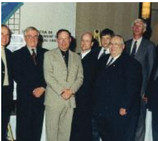
Les lauréats du gala des Prix du Mérite coopératif de 2001.