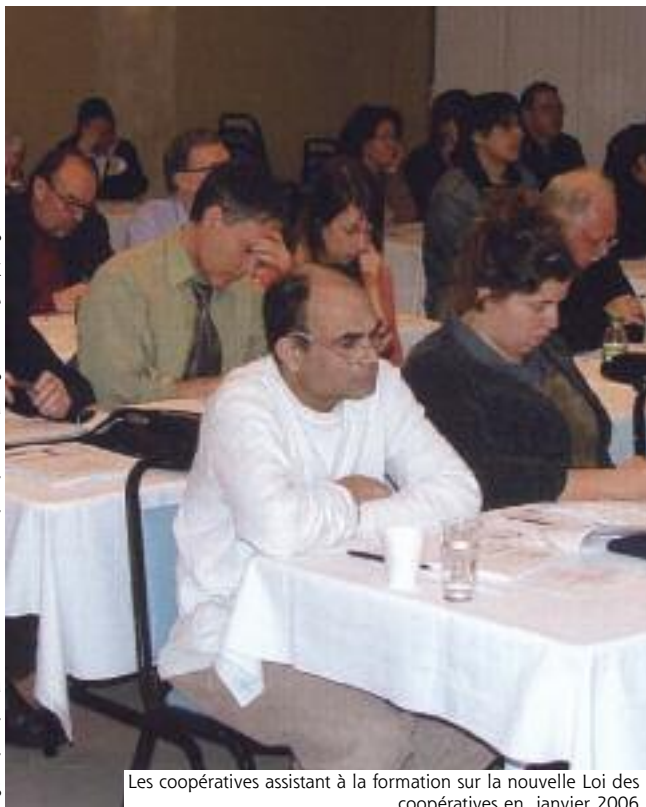
Les coopératives assistant à la formation sur la nouvelle Loi des coopératives en janvier 2006

fait de l'action politique pour développer des façons de vivre qui soient plus conformes aux aspirations humaines. Je crois que le système capitaliste est provisoire, est temporaire. Il existe depuis peu d'années finalement, et puis il va mourir un jour. J'ai trouvé dans la coopération un moyen utile, efficace, concret, pragmatique, de gagner du terrain, de prendre de l'espace, c'est-à-dire de vivre conformément à mes idées. À chaque fois, qu'on crée une coopérative, à chaque fois qu'on grossit, qu'on développe une coopérative, on prend de l'espace qui était autrefois utilisé au profit des capitalistes. Alors, ça a été ça ma vie, ma vie à partir de ce que je crois profondément. J'ai trouvé dans le développement de la coopération, dans le travail dans une coopérative d'abord, et puis dans le développement d'autres coopératives, un bon moyen de lutter efficacement pour le bien commun, pour que l'avenir de nos enfants soit meilleur que celui que nous avons connu. C'est con hein? (rires) »