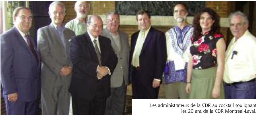
Les administrateurs de la CDR au cocktail soulignant les 20 ans de la CDR Montréal-Laval.