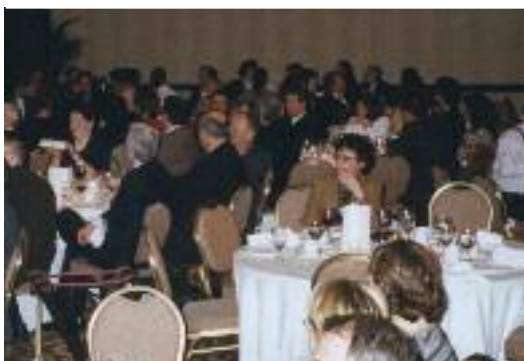
Quelques invités de la CDR lors du gala des Prix du Mérite coopératif 2001.