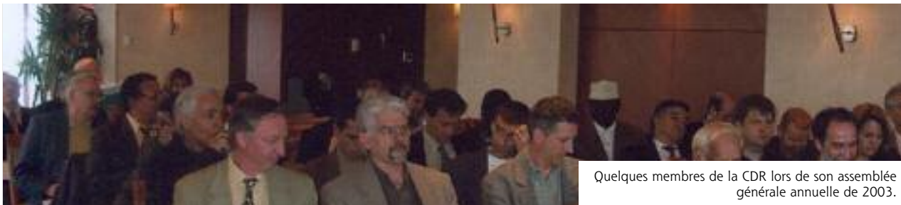
Quelques membres de la CDR lors de son assemblée générale annuelle de 2003.