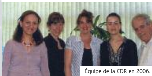
Équipe de la CDR en 2006.