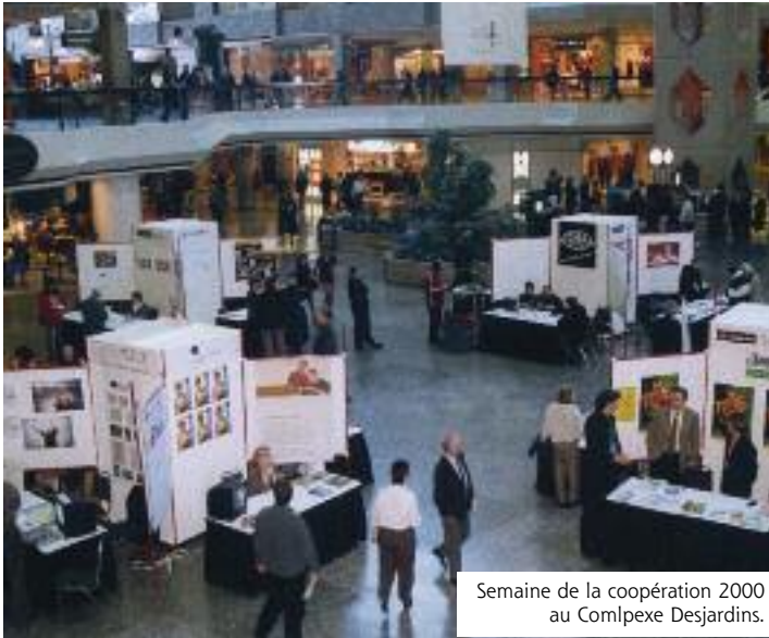
Semaine de la coopération 2000 au Complexe Desjardins.

« C'était à proprement dit son laboratoire. C'était la raison d'être du Centre de gestion des coopératives et c'est cela qui était utile pour le mouvement coopératif d'ailleurs » Guy Bisailon