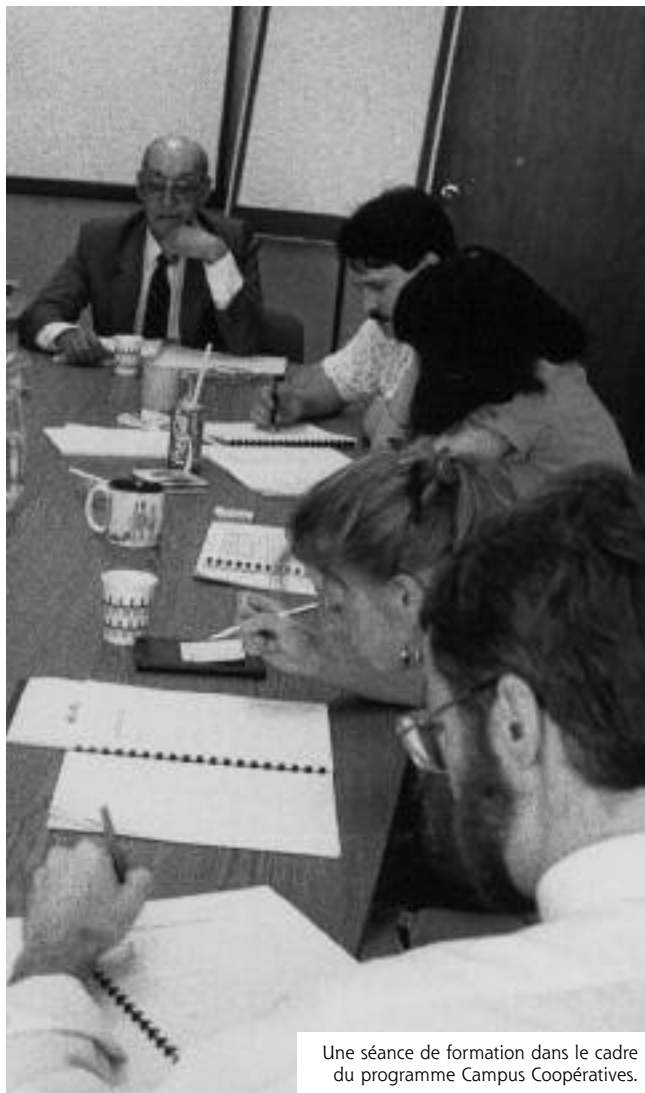
Une séance de formation dans le cadre du programme Campus Coopératives.