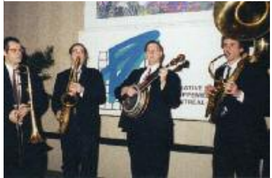
L'orchestre officiel de la CDR, Dixie Quat, 2001.