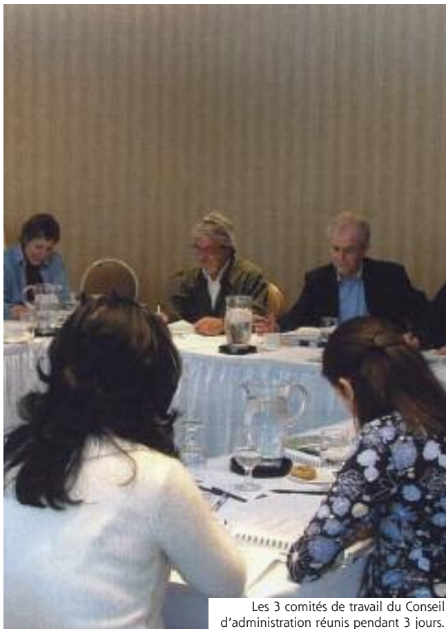
Les 3 comités de travail du Conseil d'administration réunis pendant 3 jours.

La solidarité est un outil moderne pour répondre aux besoins des communautés - surtout dans l'actuelle conjoncture de brassage économique et environnemental - et de la « relève entrepreneuriale » du Québec en quête d'outils plus appropriés. Je ne vois pas comment un outil coopératif comme la CTA ne pourrait pas prendre sa place, il me semble que cela va de soi. Et l'avènement de formules comme les coopératives de solidarité a fait la preuve qu'on est capable d'ajuster le modèle aux réalités les plus proches de ce qui se vit actuellement au Québec et dans l'ensemble du pays. Et quand on rencontre les amis des autres pays, ils nous disent :