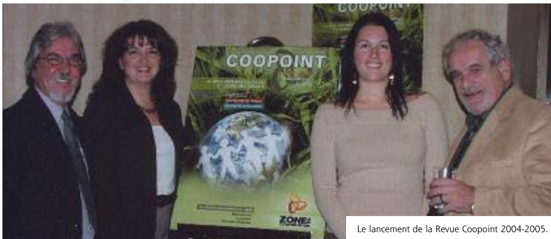
Le lancement de la Revue Coopoint 2004-2005.